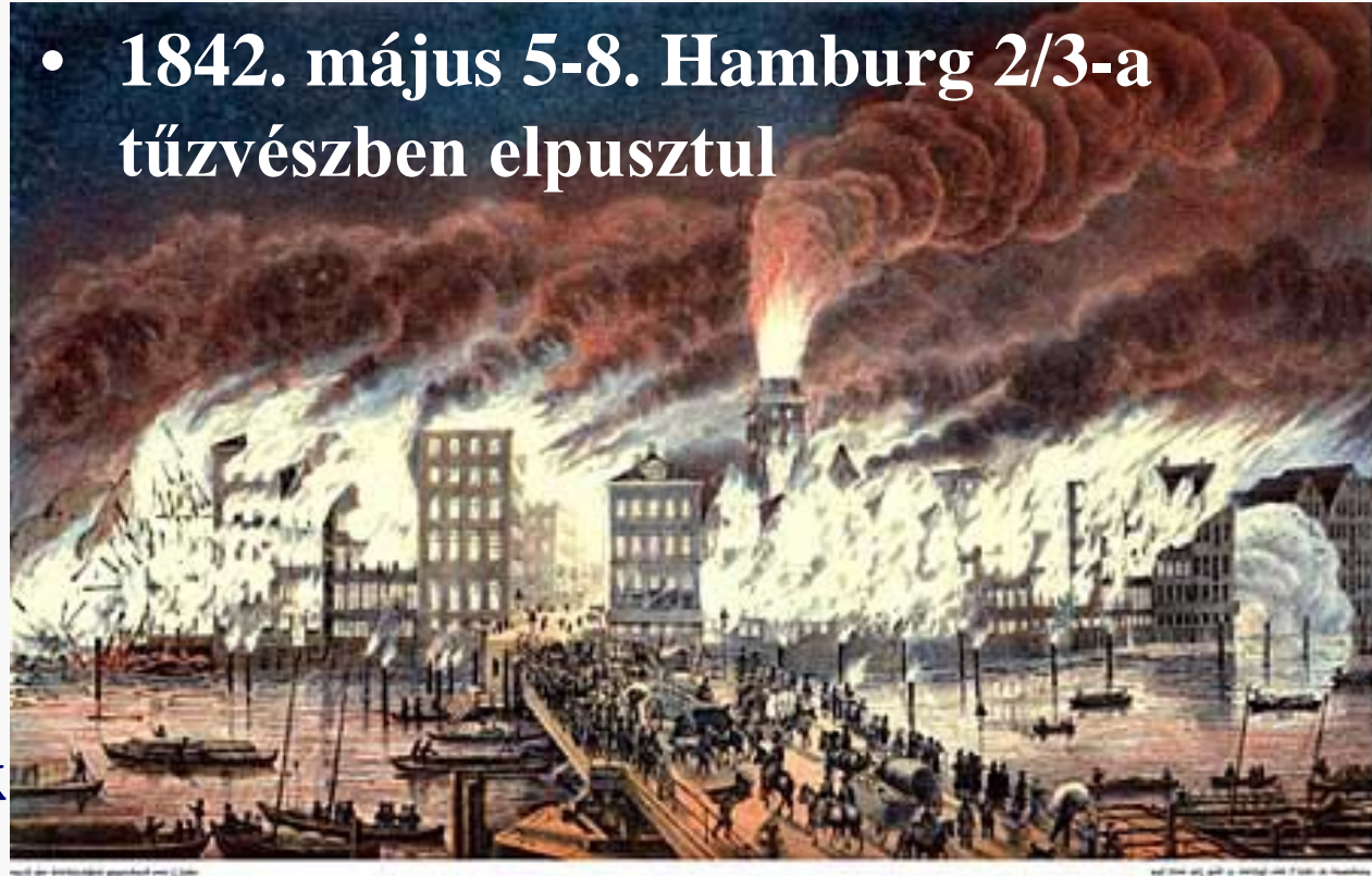
Der Brand der Nicolai-Kirche in der Nacht vom 5ten auf den 6ten Mai 1842, von der Holzbrücke gesehen